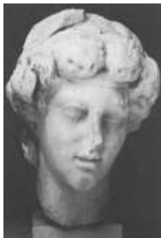
صورة رقم (7)