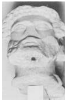
صورة رقم (5)