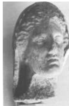
صورة رقم (4)