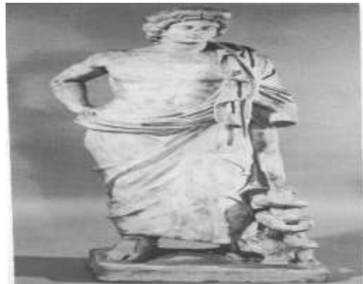
صورة رقم (1) (Thorn, 1993)