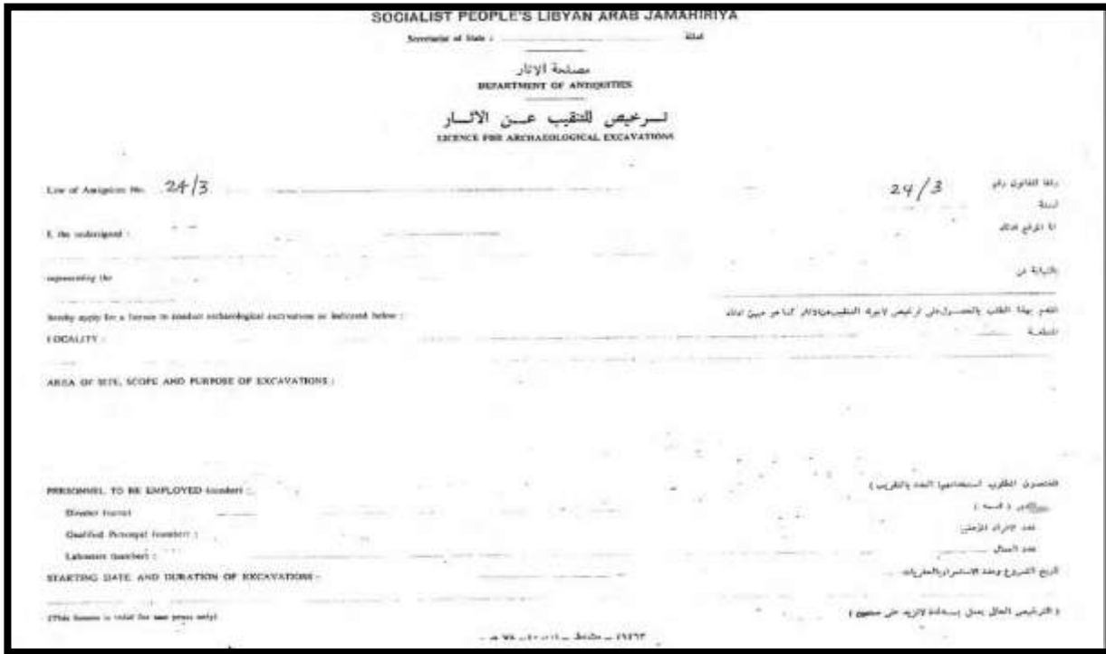
صورة رقم (7)