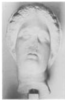
صورة رقم (6)