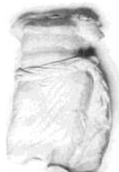
صورة رقم (3)